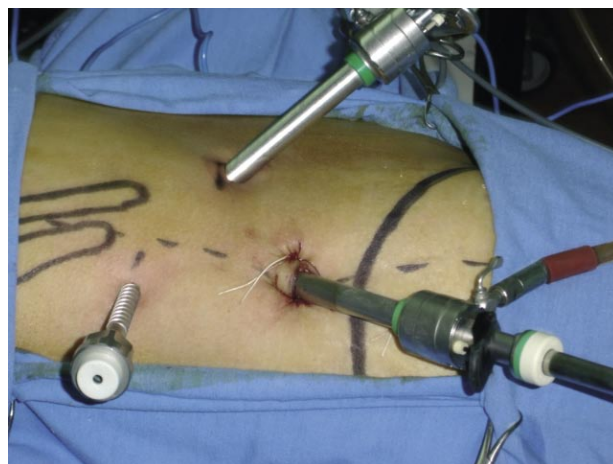
FIGURA 2. Trócares colocados, disección inicial con flujo de gas. Fijación con los puntos de piel del trócar inicial (cámara) como reemplazo del trócar de Hasson. El punto de entrada del tercer trócar se hace más posterior luego de la insuflación.

te del cirujano y se despega suavemente el tejido laxo pararrenal posterior en 360°, con especial interés de rechazar el peritoneo hacia la línea axilar anterior.