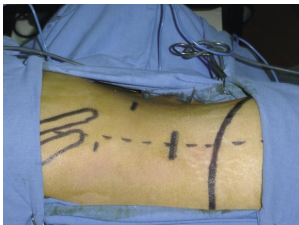
FIGURA 1. Posicionamiento de los trócares para lumboscopia derecha. 1er trócar a dos traveses de dedo por arriba de la cresta ilíaca en la línea axilar posterior, 2º trócar a nivel de la línea axilar anterior en un punto medio entre el reborde costal y la espina ilíaca anterosuperior y el 3er trócar por debajo del borde de la última costilla.