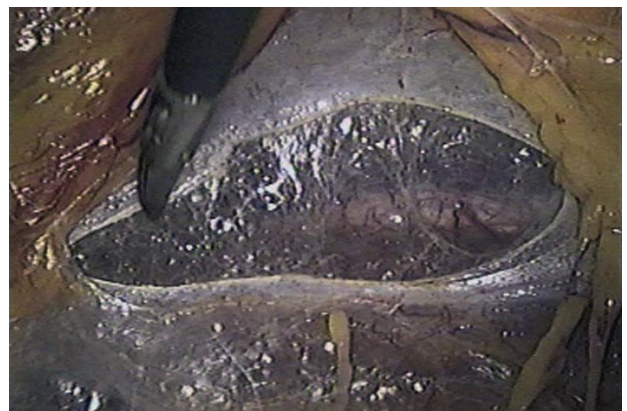
FIGURA 4. Visión lumboscópica de la apertura inicial de la fascia de Gerota. Incisión longitudinal cefalocaudal a 2 cm. del borde del psoas. Se observa la grasa pararenal en la porción anterior del espacio de trabajo.

Intentamos bajo este abordaje lumboscópico, reproducir lo realizado en una técnica abierta, siendo los resultados, en enfermedades benignas, como oncológicas, comparables, como se ha demostrado ya en múltiples publicaciones, sin ser la finalidad de este trabajo demostrarlo.